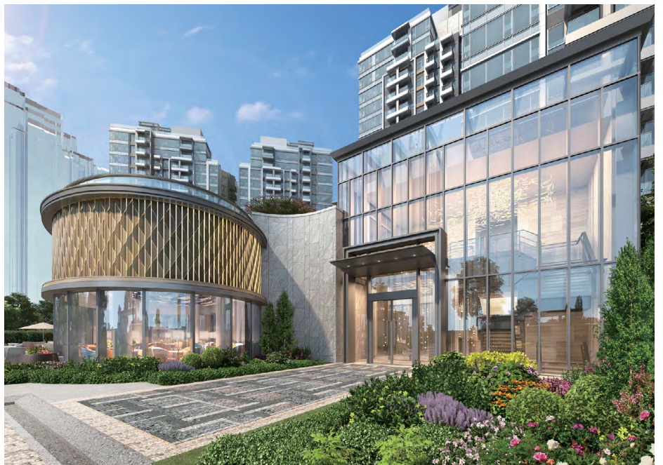
「云汇 St Martin」的私人住客会所附设外型时尚的董事屋 5